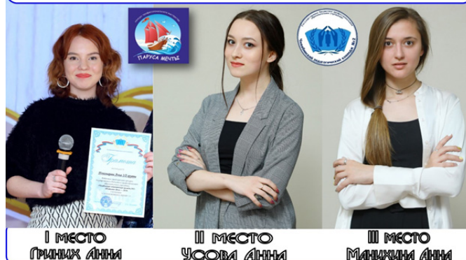
I МЕСТО ГРИНИХ АННИ

Итог VIII Конкурса профессионального мастерства «Паруса мечты» на лучшего студента Государственного бюджетного профессионального образовательного учреждения «Челябинский педагогический колледж №2», будущего воспитателя дошкольной образовательной организации