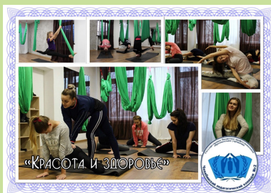
«КРАСОТА И ЗДОРОВЬЕ»

Коллектив студентов ЧПК №2 благодарит инструкторов, которые теоретически и практически доставили массу положительных впечатлений, надеемся на продолжение сотрудничества и работу в режиме онлайн.