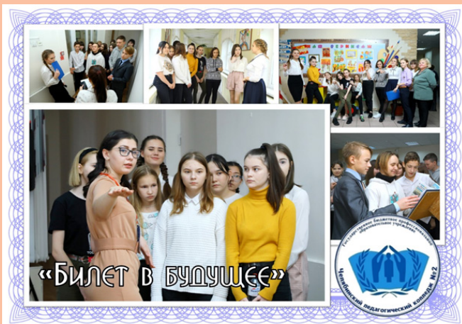
«БИЛЕТ В БУДУЩЕ»

Более 100 учеников 6-11 классов общеобразовательных организаций города Челябинска приняли участие в мероприятиях ознакомительного характера. Для гостей ЧПК №2 была организована экскурсия на чемпионат, которая заключалась в прохождении группы по маршруту, с посещением соревновательных площадок, в рамках чемпионата WSR. Студенты-участники Чемпионата, разных лет, рассказали о чемпионате и движении WorldSkills, возможностях участия школьников в юниорских соревнованиях, дали общую информацию о компетенциях, включённых в маршрут группы. А также поделились своим мнением об обучении и получении профессии в Челябинском педагогическом колледже №2.